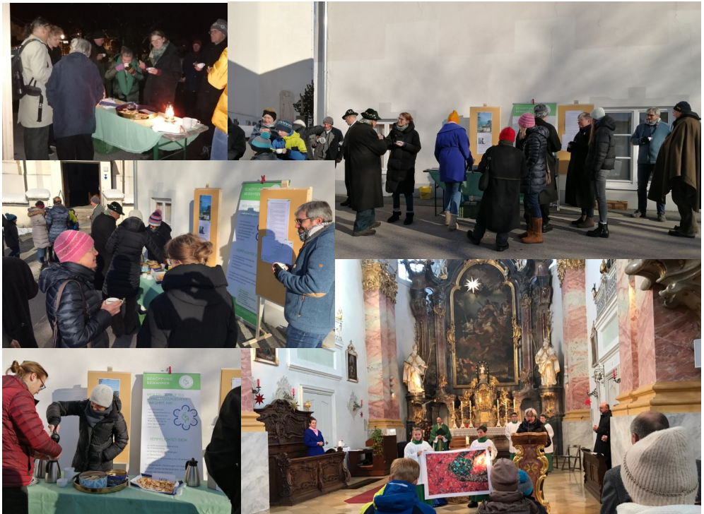
Fotoeindrücke von der Auftaktveranstaltung (28./29.01.2023)